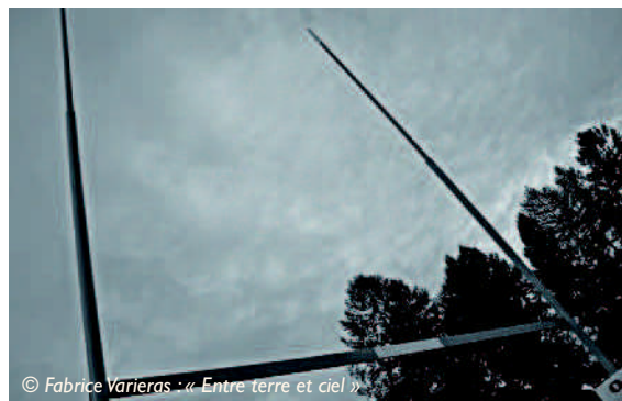
© Fabrice Varieras - « Entre terre et ciel »